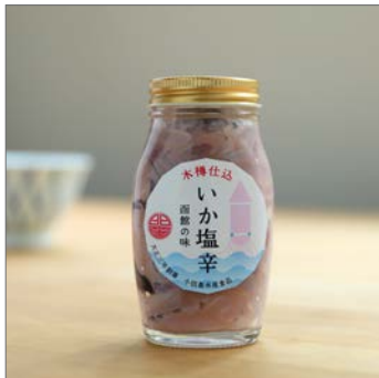
【函と館限定商品】 木樽仕込 いか塩辛 税抜金額：100g入り 600円 180g入り 900円 発売月：2015年12月