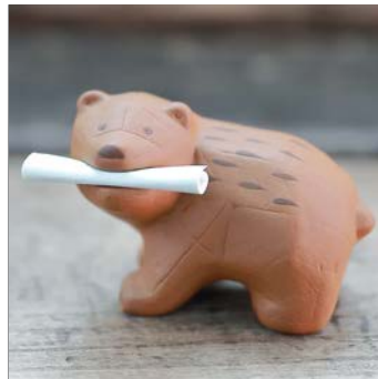
【函と館限定商品】 函館熊みくじ（函館弁） 税抜金額：400円 発売月：2016年3月