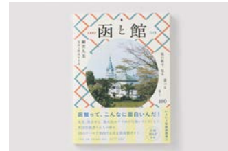
街の魅力を伝える旅行ガイド本「函と館」の出版