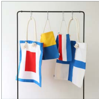
【函と館限定商品】 国際信号旗フラットバッグ 税抜金額：小 3,800円 大 8,800円 発売月：2015年12月

地元の職人・作家の手仕事による「国際信号旗フラットバッグ」や「五稜郭鍋敷き（陶器）」、100年以上の歴史をもつ老舗の「木樽仕込 いか塩辛」、店内にあるお好きな商品を詰めて手巻きの製缶機で、封缶作業をして頂ける限定ギフトパッケージの「函缶（KANKAN）」、中川政七商店と共同開発した「函館ふきん」やオリジナルテキスタイルの「いかろうこ小紋」のシリーズ、「キタキツネの親子」の小物、函館弁の「函館熊みくじ」、「HASAMI 函と館オリジナルブロックマグ」など函館空港でしか買えない限定商品を多数取扱っております。