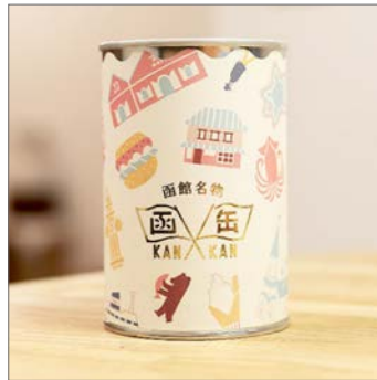
【函と館限定パッケージ（有料）】 函缶（KANKAN） 税抜金額：小 150円 大 180円 発売月：2015年12月