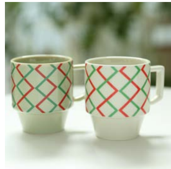
【函と館限定商品】 HASAMI 函と館ブロックマグ 税抜金額：（各色）2,250円 発売月：2016年9月