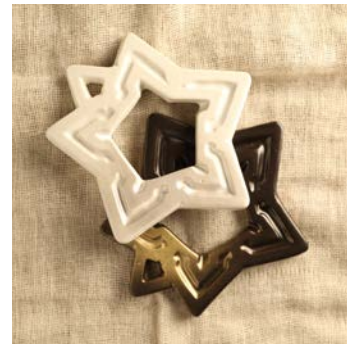
【函と館限定商品】 五稜郭鍋敷き（陶器） 税抜金額：1,500円 発売月：2015年12月