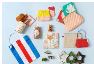
街の魅力を伝える土産もの開発